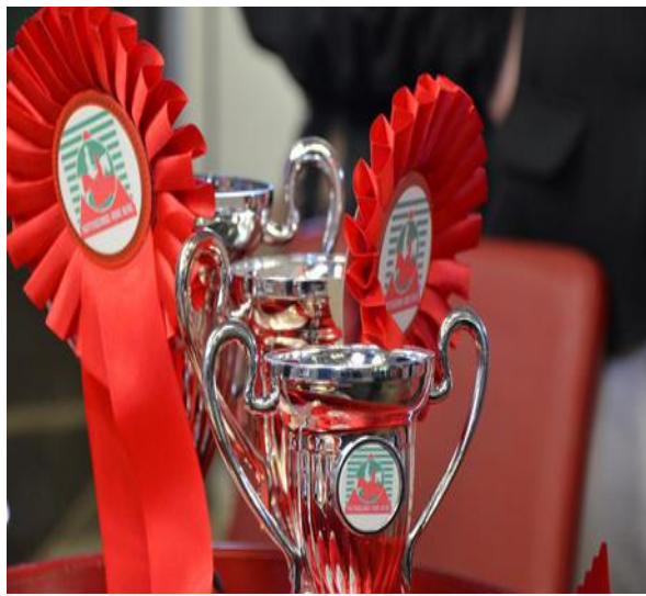
DE ARK KORTEMARK

INTERCLUBKAMPIOENSCHAP ZONDAG 11 AUGUSTUS